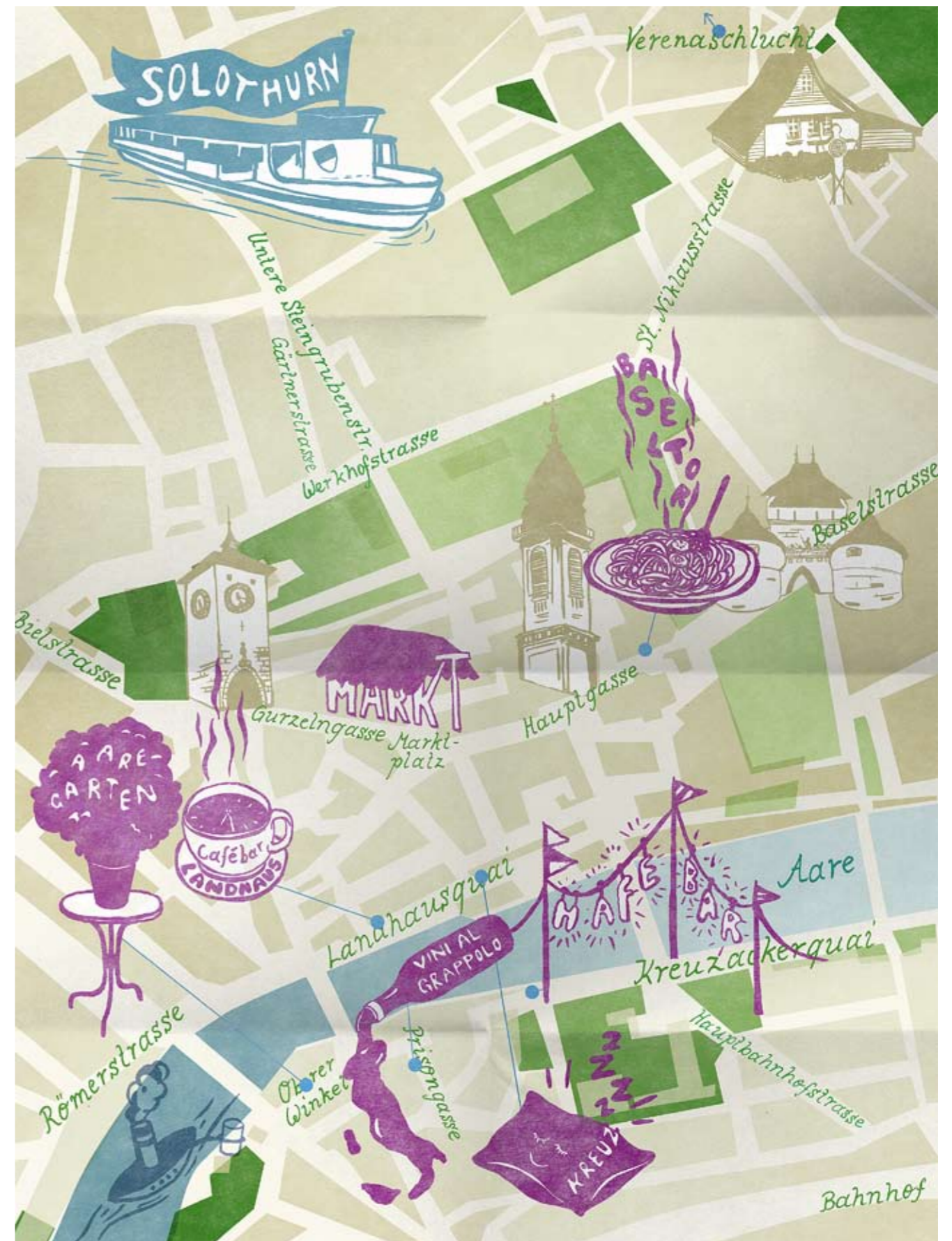
Illustration: Anna Haas