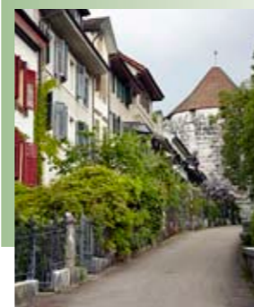
Beliebteste Wohnlage von Solothurn: die Häuser entlang der Stadtmauer oberhalb des Baseltors.